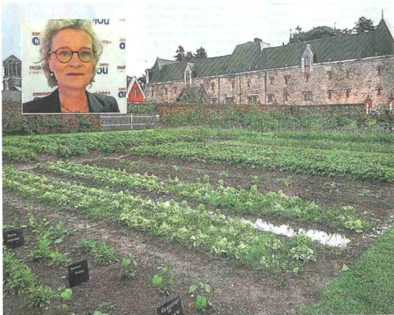
Le potager associatif de Challain-la-Potherie qui se détache sur les dépendances du château. C'est l'un des nombreux clichés de « Parcs et Jardins de l'Anjou » édité par le Conseil Départemental. En médaillon : l'auteur de cet ouvrage, Isabelle Levêque.

chapitres sont consacrés aux jardins d'abbaye, aux jardins d'eau et de pentes, aux jardins anglais, aux parterres à la française, aux jardins botaniques ou encore aux architectures domestiques.