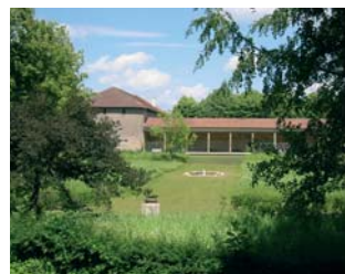
Fig. 6 : Le théâtre de verdure, cl. I. Levêque.