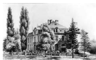
Fig. 3 : Vues de Pange « d'après les dessins de M. le C te Ad ph e de Caraman » (vers 1839), collection particulière.