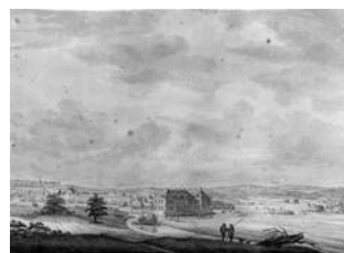
Fig. 2 : Dessin, « Dessiné d'après nature le 12 may 1766. La vue du village et château de Pange, avec ses environs », collection particulière.

Au début du XIX e siècle, le domaine semble avoir été entièrement remanié. Sur le plan architectural, l'aspect défensif disparaît en 1806 avec le comblement des douves et la démolition des deux tourelles fermant l'accès à la cour du château. La « marcarerie » ou porcherie est transformée en écurie. La grange remarquable demeure conservée. Le jardin régulier supposé disparaît et laisse place à l'une des parcelles d'un parc paysager que l'on peut découvrir sur de nombreux documents. Le comte de Choulot, auteur présumé de ce projet à l'anglaise, cite le marquis de Pange parmi ses clients 10 . Malgré l'absence de plan original signé du paysagiste, un plan de la main de l'architecte A. Grunier-Grenier indique le nouveau tracé général en 1836 11 . L'architecte intervient alors pour remanier les toitures à la Mansart et procéder à des aménagements intérieurs. Des lithographies et dessins du comte Adolphe de Caraman montrent en 1839 une sélection d'arbres d'essences diverses disposés autour du château (fig. 3). On y remarque différents conifères, arbres pleureurs et groupes de peupliers d'Italie déjà adultes.