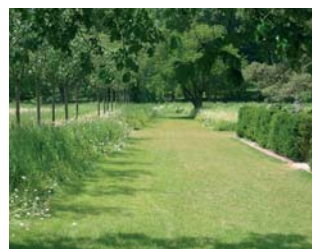
Fig. 7 : L'allée entre la prairie fleurie et la chambre d'ombre, cl. I. Levêque.