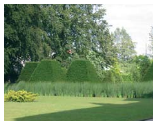
Fig. 8 : Arc de Miscanthus et d'iris devant les pyramides d'ifs, cl. I. Levêque.