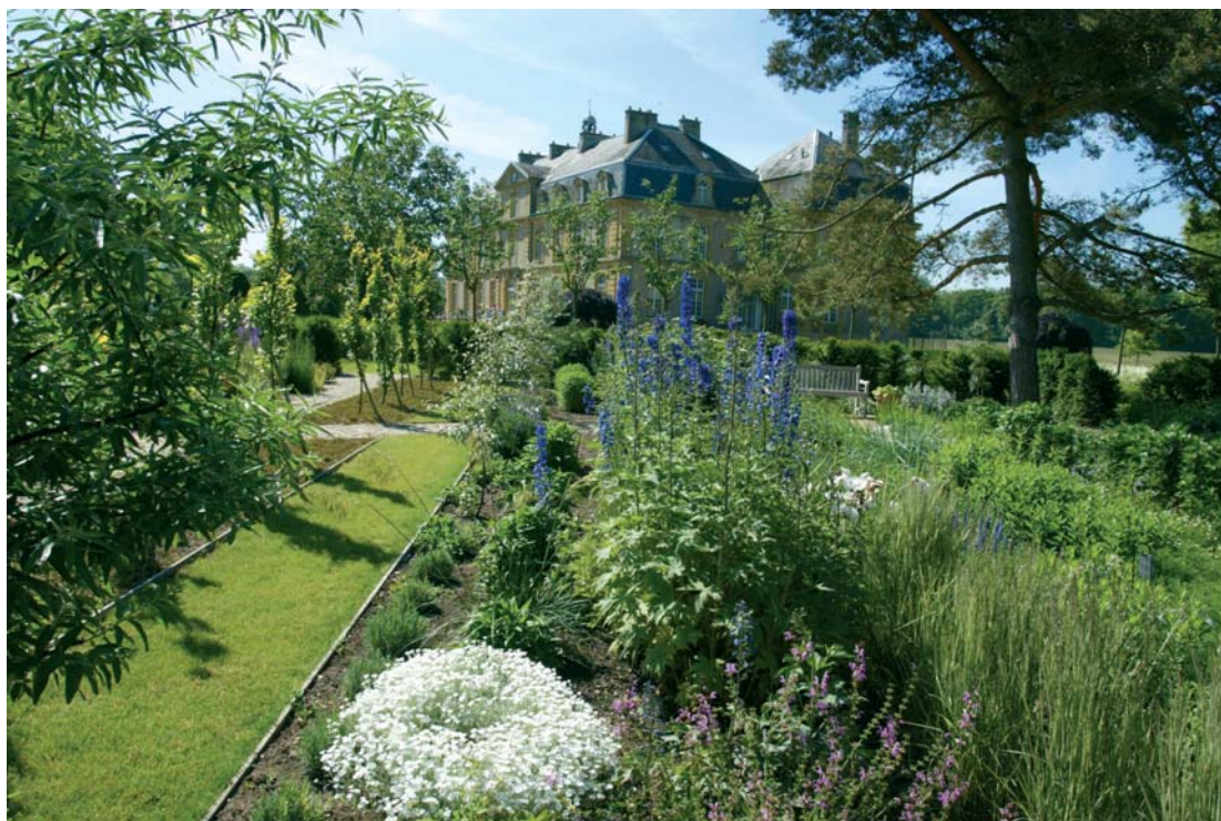
Fig.5 : Le château de Pange entrevu depuis les jardins, cl. J.-C. Kanny, comité départemental du tourisme de la Moselle.

Aux abords du château, le souvenir des anciennes douves en fer à cheval apparaît sur la pelouse à travers un très léger glacis en courbe et un traitement en différentes hauteurs de tonte. Ce parterre est venu remplacer la cour minérale et adoucir le devant de la façade nord. L'encadrement de l'espace est assuré de façon asymétrique par des pyramides tronquées d'ifs sombres, vestiges de la composition des années 1950, et par deux arcs nouvellement créés d'un mélange de Miscanthus et d' Iris pseudacorus . Au centre de ce parterre irrégulier, quatre carrés d'ifs dorés viennent lier habilement l'axe de l'allée d'arrivée et celui du château.